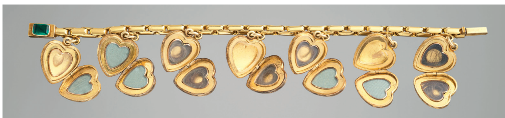
Bracelet aux pendants en forme de cœur Or et gemmes, l. 17,5 cm Chantilly, musée Condé, 2024.5.1

Het uitgebreide onderzoek dat voorafging aan deze tentoonstelling en de bijhorende catalogus laten een heel andere kant van haar zien. De koningin der Belgen had een degelijke artistieke opleiding genoten, had een scherpe politieke geest en was een fervent brievenschrijfster. Ze was het middelpunt van een groot netwerk van ervaren mecenasen en gedegen vorsten, terwijl ze tegelijkertijd heel persoonlijke voorkeuren aan de dag legde en een bijzondere rol speelde binnen de diplomatieke betrekkingen. Veel nooit eerder gepubliceerde werken uit haar collectie worden hier voor het eerst getoond, naast ontroerende memorabilia en officiële of intieme voorstellingen die vaak weinig bekend zijn, ook al werden ze uitgevoerd door de grootste kunstenaars van die tijd. Het sprak voor zich dat voor de opwaardering van deze figuur een Belgisch-Frans partnerschap zou worden gevormd: de Dienst Musea en Cultureel Erfgoed van de provincie Namen, een streek die Louise graag bezocht, en het Musée Condé in het Château de Chantilly, met in de collectie van de hertog van Aumale een aantal werken over zijn zus Louise. Beide instellingen werkten met veel plezier samen om het romantische lot van Louise d'Orléans, de eerste koningin der Belgen, te belichten.