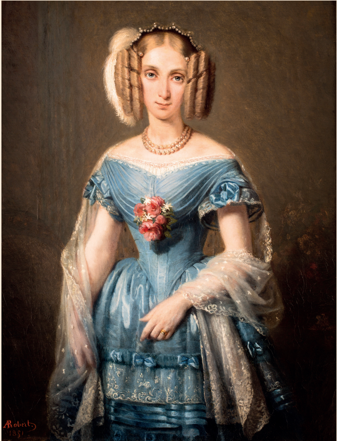
Alexandre Robert La Reine Louise-Marie 1851

Huile sur toile, h. 51 cm; l. 37 cm Bruxelles, musée BELvue, Collection de l'Association royale Dynastie et Patrimoine culturel, inv. A2199/1