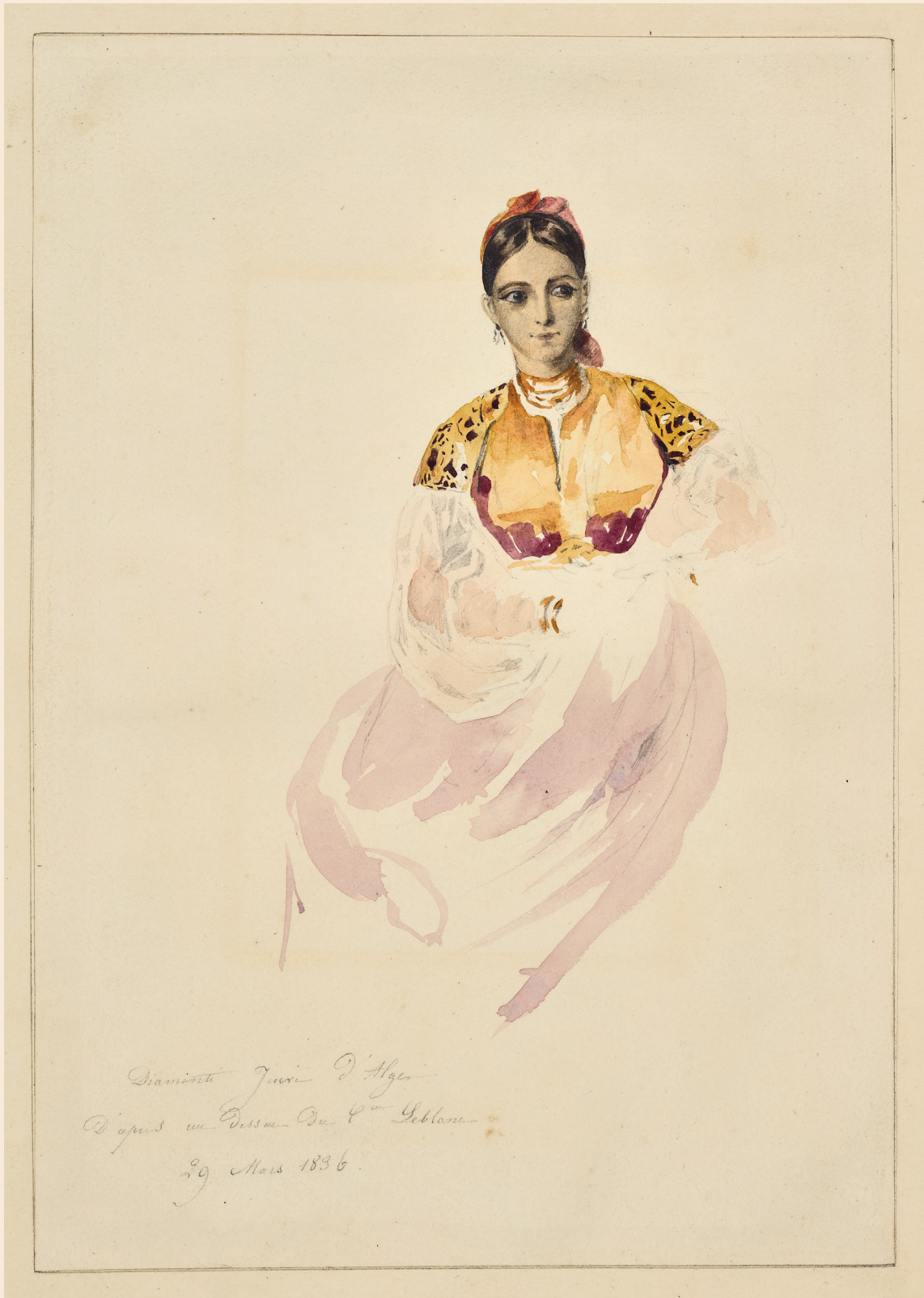
Louise d'Orléans Diamante juive d'Alger , d'après un dessin du peintre Leblanc 29 mars 1836 Aquarelle sur papier Bruxelles, APR, fonds Comte de Flandre, inv. 369: album des œuvres de Louise d'Orléans, fol. 11