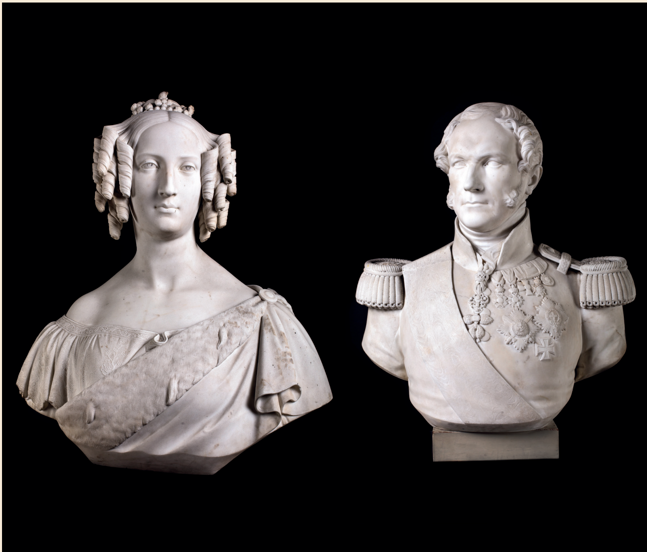
Guillaume Geefs Buste de la reine Louise 1857

Marbre, Namur, collection provinciale, inv. P150