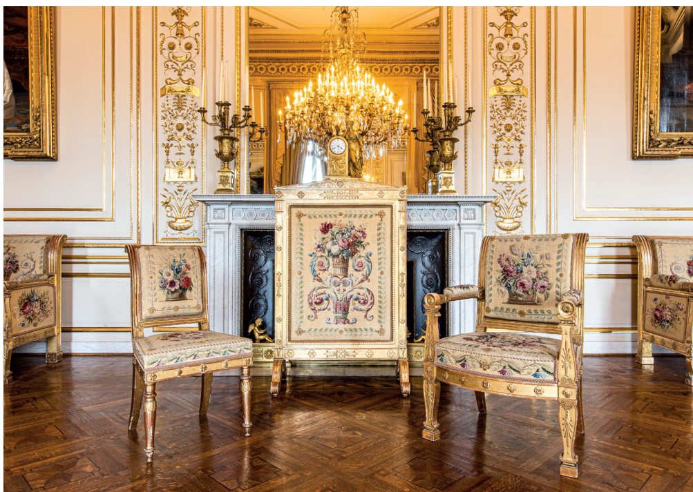
Fauteuil des Salons blancs du Palais royal de Bruxelles h. 96 cm; l. 64 cm; prof. 73 cm Belgique, Collection royale, inv. P0336

Het verlaten van haar familie was voor Louise d'Orléans hartverscheurend, maar vanaf het begin zette de jonge vorstin zich achter de nieuwe natie die ze begon te ontdekken. Hoewel ze geen vrouw met macht was, toonde ze al snel de talenten van een gewiekst politica en bouwde ze een ongekende positie op: die van eerste koningin der Belgen.