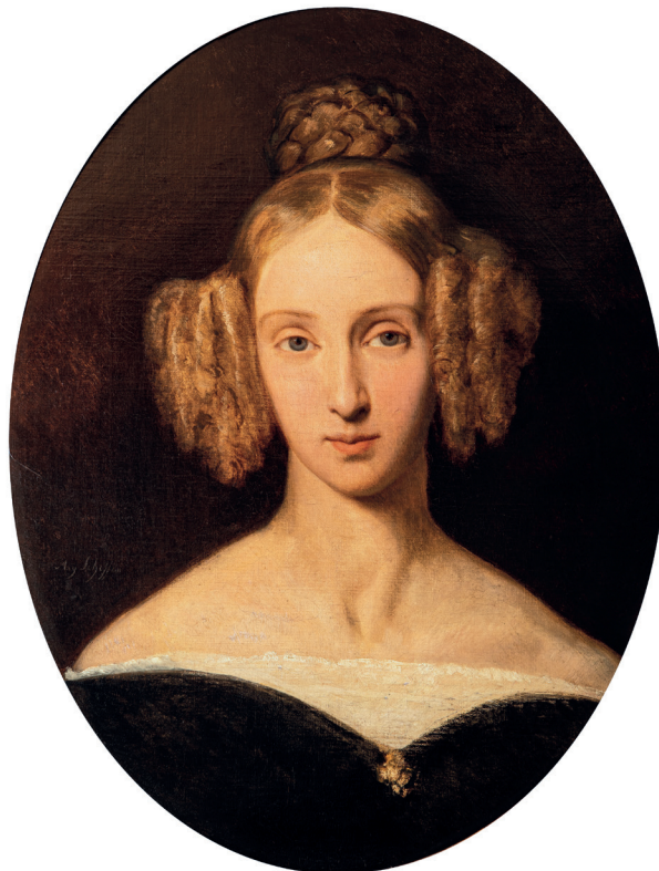
Ary Scheffer Louise d'Orléans Vers 1836

In 1834 werd het koninklijk paar diep geraakt door het verlies van hun eerste zoon, Louis-Philippe. Een nieuwe erfgenaam, Leopold, werd geboren in 1835, gevolgd door Philippe in 1837 en Charlotte in 1840. Als kind kon Leopold chagrijnig zijn en vond hij dat zijn ouders de voorkeur gaven aan zijn jongere broers en zussen. Philippe en Charlotte waren erg close en leken zachtardiger en aanhankelijker. Louises kinderen kenden als volwassenen uiteenlopende lotgevallen.